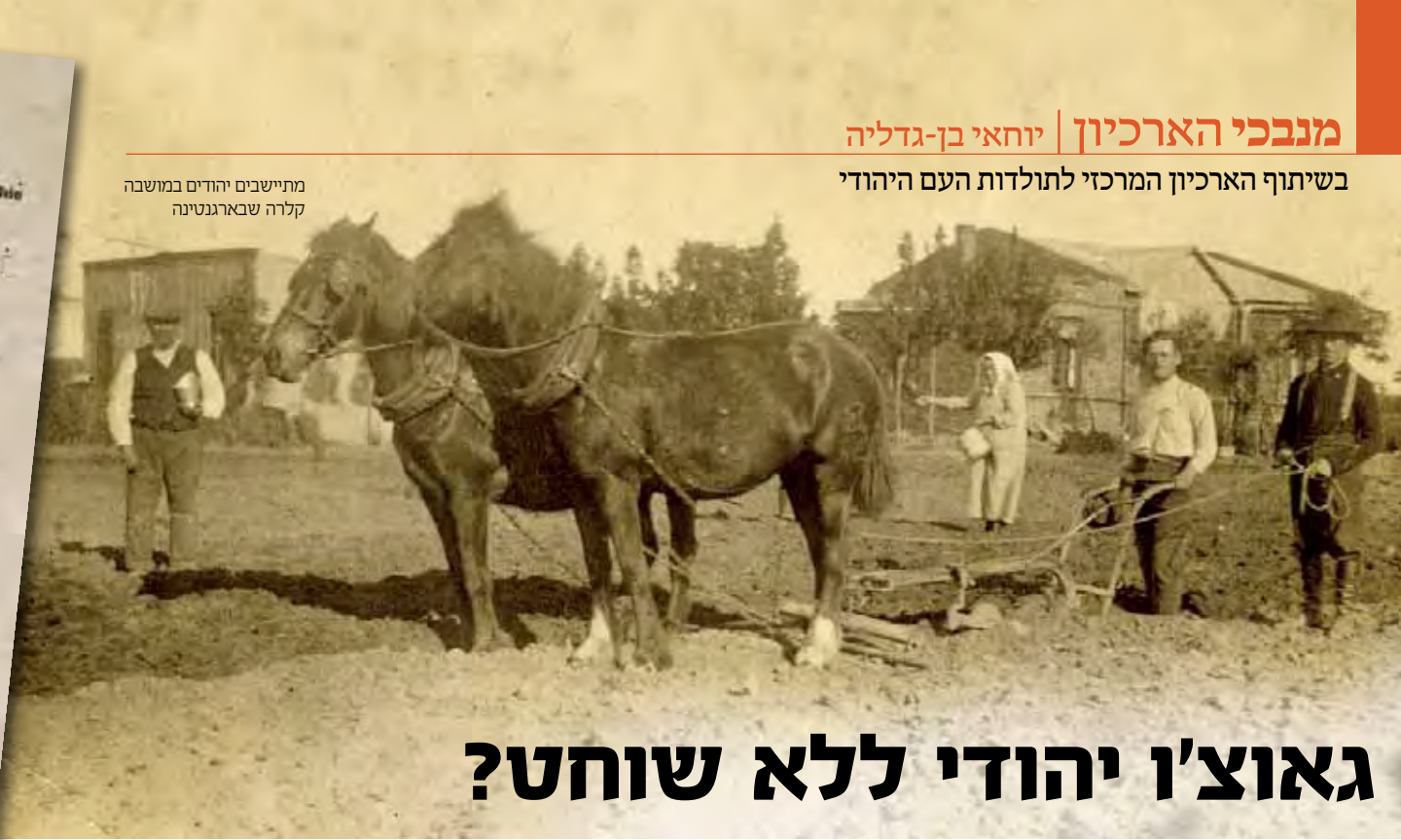
מתיישבים יהודים במושבה קלרה שבארגנטינה